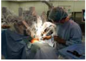
ダビンチ手術の様子

肺がんに対する手術は時代と共に進歩しており、現在では手術を受ける人の約7割は治癒（5年以上再発なし）しています。その中で外科治療の発展の主流は低侵襲化にあり、切除する肺を可能な範囲で縮小することと創（キズ）を小さくすることの2つの流れがあります。肺がんに対する標準手術は60年以上前から肺葉切除とリンパ節の摘出ですが、最近では早期の肺がんや呼吸機能の悪い人などを対象として、肺をできるだけ温存する区域切除や部分切除も行うようになってきました。