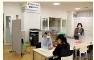
マイナンバーカード新規申請を市役所地下市民ラウンジで受付中！

【申請受付時間】 平日：午前8時30分～午後5時 問 戸籍・住民登録課（☎24-1158 FAX 24-1353）へ。