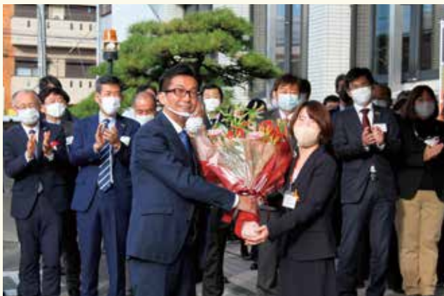
職員から花束を受け取る伊藤市長

昨年11月29日に行われた市長選挙で、現職の伊藤市長が再選し、3期目の市政がスタートしました。11月30日、選挙後初めて登庁した市長は「これから4年間、市民の命や生活を守ることに全力を注ぎたい」と決意を述べ