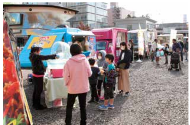
11 新しい桑名駅での初イベント! 15 くわなエキスポ EX2020

NTNシティホールで意見発表会と講演会が行われました。今年の講演会は徳島県の阿波木偶箱まわしの人形浄瑠璃の実演と被差別民衆の生活文化や伝統芸能についてお話いただきました。