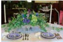
昨年6月開催時作品