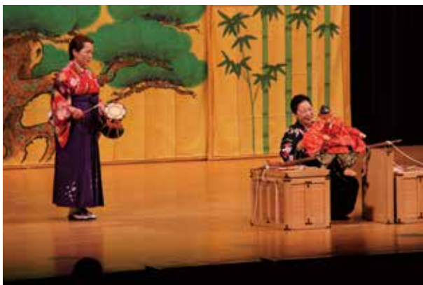
12 徳島の伝統芸能に魅了 5 2020人権フェスタ in くわな

オリンピック聖火の巡回展示が市民会館で行われ、多くの人を訪れました。訪れた人は、東京2020オリンピック聖火リレーランタンに輝く炎を見て感動している様子でした。また、元バドミントン選手の小椋久美子さんと鈴木英敬知事の対談も行われました。