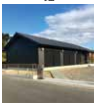
コミュニティセンター