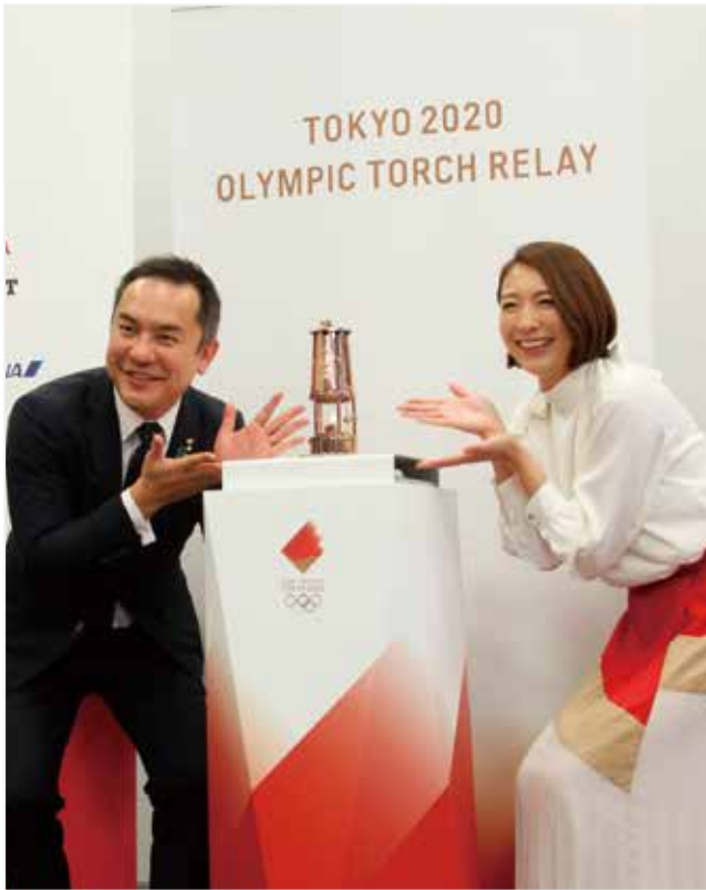
11 聖火が桑名にやってきた! 13 東京2020オリンピック聖火