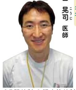
呼吸器外科・心臓血管外科 非常勤医師

また以前は肋骨や筋肉を切除する開胸手術がほとんどでしたが、胸腔鏡と呼ばれる内視鏡での手術が主流となりました。さらに最近ではロボット手術も急速に普及しており、三重大学では多くの症例を行っています。それらにより現在の肺がん手術では、手術翌日より食事を摂って歩行も開始し、1〜2週間で退院が可能となります。