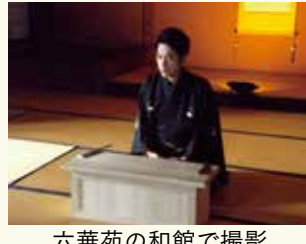
六華苑の和館で撮影