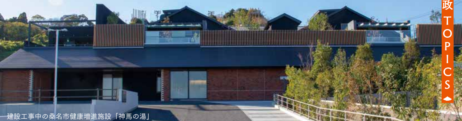
建設工事中の桑名市健康増進施設「神馬の湯」

桑名市健康増進施設「神馬の湯」は「温泉」を活用した「予防を重視した市民が主役の健康づくり」を目的とし、公民連携によって進めている民設民営の施設です。市が施設建設のための土地を貸し出し、賃料（収入）を得ながら税金を使うことなく、建設から運営までを民間事業者（葛井 つたい 株）の力を生かして行います。 昨年広報くわな5月号で令和2年12月オープン予定とお知らせしていましたが、皆さんが安心・安全にご利用していただけるよう、新型コロナウイルス感染症対策に伴う施設改良工事を行うため、3月下旬オープンと時期が延期となりました。ご利用を楽しみにされていた皆さんには、ご迷惑をお掛けしますがご理解のほど、よろしくお願いいたします。 ▷今後、新型コロナウイルス感染拡大の状況によっては、オープンの予定が変更する場合があります。