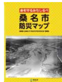
広報くわな9月号と一緒に配布される防災マップ

避難とは、難を避けることです。ハザードマップなどでご自宅を確認し、安全な場所であれば避難する必要はありません。また、避難先は公的避難所だけではありません、特に「南海トラフ地震臨時情報(巨大地震警戒)」発表時には1週間という長期の事前避難を求められますので、あらかじめ安全な親戚・知人宅などに避難することをお考えください。