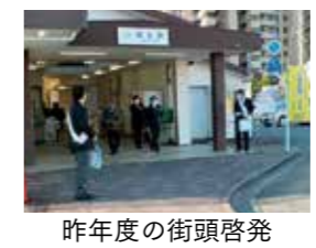
昨年度の街頭啓発

1948(昭和23)年12月10日、国連総会で世界人権宣言が採択されました。この日を最終日とする1週間は「人権週間」です。 市では、これに合わせて街頭啓発や人権相談などを実施します。 この機会に、皆さんも人権について正しい理解と知識を持ち、身近にある人権問題について考えてください。お互いの人権を尊重できる豊かな社会をめざしましょう！ 今年度は人権週間内の12月6日(日)に、市内で街頭啓発を実施します。