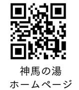
神馬の湯 ホームページ

【営業時間】 平日(月～木曜日) 午前9時～午後11時 金曜・祝前日 午前9時～午前0時 土・日・祝日 午前7時～午前0時 【入館料】 平日 大人880円 小学生以下360円 土・日・祝 大人1,100円 小学生以下420円 ▷11枚綴り8,800円回数券販売中。土日祝は200円追加 【休館】第3月曜日は午後3時から営業、祝日の場合は翌日