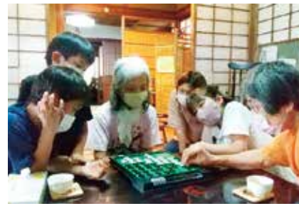
子どもから大人までさまざまな年代の人が一緒に遊んだり、お話をしたりして楽しく交流しています

桑名の憩い 代表者は、コロナ禍で、人と人とのつながりの大切さが再認識される中、地域の「たまり場・居場所」「人と人がつながることを大事にする」「行く」とほっとできる場所づくりをめざしていたところ、ちょうど良い空き民家を利用できることになり、昨年8月にスタートしました。 平均参加人数は5人ほどで、子どもから高齢者まで、さまざまな年代の人の交流の場になっていきます。健康体操や、おしゃべり、ミシンなどを使って手芸などを行っている人もいます。認知症があっても、得意な料理やお菓子を作って持参し、試食をした皆さんから「おいしい」という声を掛け