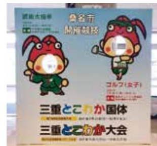
ヤマモリ体育館2階ロビー

三重とこわか国体の開催に対する市民の関心や参加意識の高揚を図るため、ポスターや懸垂幕を作成するなど広報活動に取り組んできました。