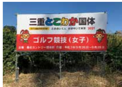
桑名カントリー倶楽部付近交差点