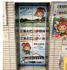
市役所1階エレベーター