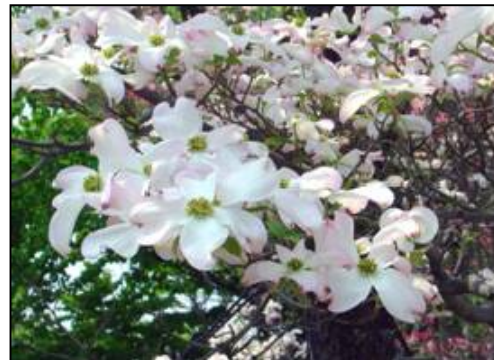
市の木「ハナミズキ」