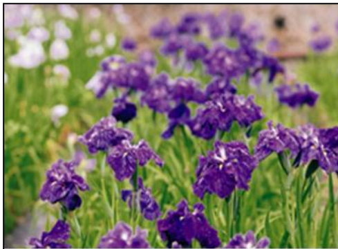
市の花「ハナショウブ」