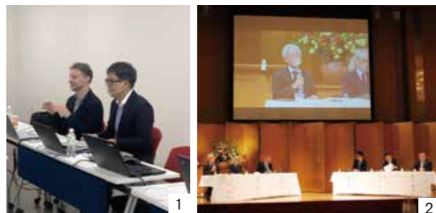
①海外からリモートで視察を受け入れている様子 ②全国産業観光フォーラム in 桑名は、現地参加とリモートを併用して開催

産業観光とは、その地域特有の産業に関するもの(工場、職人、製品など)を観光資源とする旅行のことです。市では、さまざまな業種の企業や学校などと協議会を設立し、年間約3,000人を超える人が桑名市を訪れていました。コロナ禍で海外から日本を訪れることが難しい中で、視察や全国から参加者が集まる会議にもリモートを取り入れるなど、積極的に稼げる仕組みを構築しています。