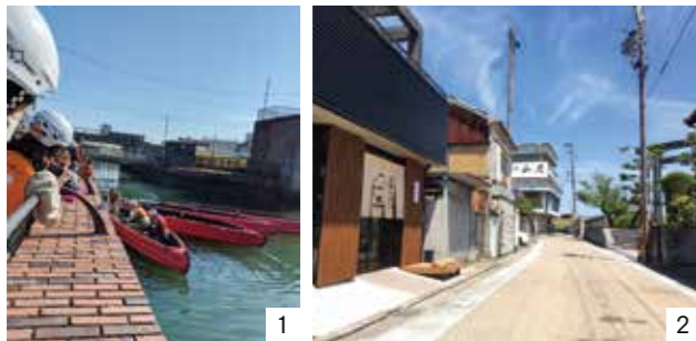
①かわまちづくり協議会で住吉エリアを視察する様子 ②平成30年に七里の渡し前にオープンした「宿場の茶店 一(ハジメ)」

桑名七里の渡し公園も休憩スペースが整備され全面開園し、今後ますます住吉エリアの活性化が期待されます。