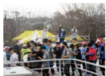
揖斐川沿いを走る「桑名マラソン走りま SHOREN!」などのイベントでも活用されています。

市がかわまちづくり協議会」を設立し、桑名の顔となる住吉地区・七里の渡し周辺のエリアマネジメントにも取り組んでいます。京都といえば、多くの人が祇園の街並みイメージするように、桑名といえば、住吉地区・七里の渡し周辺をイメージするようなまちづくりを、地域の団体や民間事業者、行政が連携して市民連携を進めます。