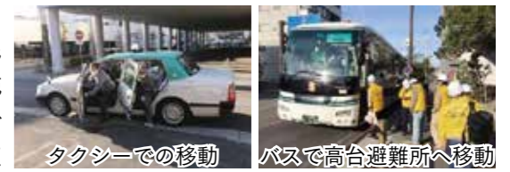
タクシーでの移動 バスで高台避難所へ移動

令和3年11月6日に行われた精義地区と七和地区の合同自主防災訓練では、浸水想定区域である精義地区の住民を自宅から精義まちづくり拠点施設へタクシーで、拠点施設からは七和小学校を高台の避難所として仮定し、バスで移動するといった流れを確認しました。移動後は、2地区合同で各地区の住民や消防団員など約100人が参加してコロナ禍に対応した避難所開設訓練が実施されました。