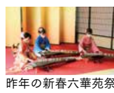
昨年の新春六華苑祭

料金 入苑料…一般(高校生以上)460円、中学生150円 ▽小学生以下の人は、保護者同伴でご来苑ください。