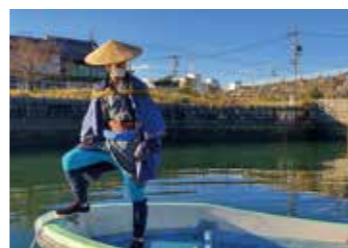
ミステリーハンターが熱田宿から桑名宿までの七里の渡しを舟で渡ったときのワンシーン

【桑名フィルムコミッション】は映画やドラマなどの撮影場所誘致や撮影支援をする機関です。映像を通じて、桑名の魅力を発信し、地域の活性化を図ります。