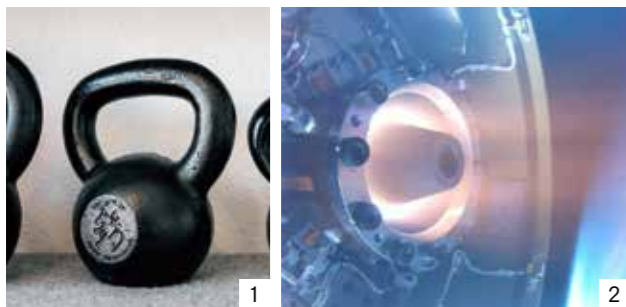
①伊藤鉦鑄工所が製造したふるさと納税でも評判の国産ケトルベル ②水谷精機工作所が部品供給したロケットの新型エンジン

桑名は、ものづくりのまちとして発展してきました。江戸時代から製造が始まり、全国的にも有名な鑄物業界では「くわな鑄物」とブランド化を図り、新商品の開発を行う企業が増えています。また、市内には高い技術力を持った企業が多く、鉄工業界では、宇宙航空研究開発機構(JAXA)が打ち上げるロケットに部品供給をしている企業もあります。発展し続ける市内企業の本物を発信していきます。