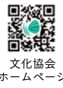
文化協会ホームページ