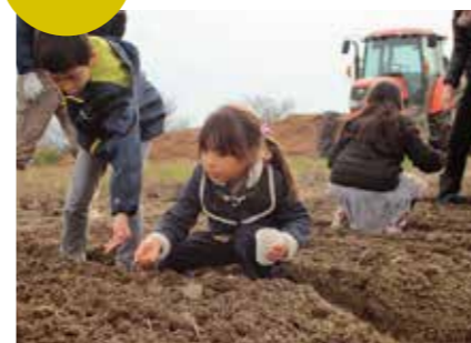
桑名ほんばくのプログラムで行った桑名もち小麦の種まき