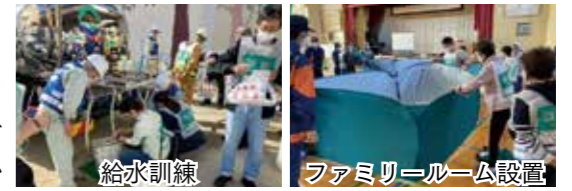
給水訓練 ファミリールーム設置

また、11月7日には、桑部小学校において、避難所運営訓練や応急給水訓練が実施され、地域住民や消防団員など約60人が参加し、コロナ禍の避難所開設訓練のほか、市では初めて応急給水訓練が実施されました。