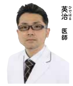
総合医療センター 歯科口腔外科

おいしい食事をしっかり食べて健康を維持するためにはお口の管理が重要です。お口の病気はお口だけでなく、全身の健康に影響することが分かっています。特に45歳以上で半数以上の人がかかっている歯周病はさまざまな病気に影響を与えます。 糖尿病は歯周病による歯肉の炎症が続くと、血糖を下げる働きをしているインスリンが効きにくくなり、血糖が上昇し悪化することがあります。そのため、歯周病の治療を受け、歯肉の炎症を治した結果、糖尿病が改善することもあります。 その他にも歯肉の炎症が続いている人は、脳の血管が詰まってしまいう脳梗塞が健康な人よりも2・8倍発生リスクが高いとされ、妊婦さんでは早期低体重児出産の危険性が7倍高いと言われており、その他にもさまざまな疾患との歯周病の関連が分かっています。 歯周病や虫歯の治療など歯科治療の大きな役割は、食事をしっかりと