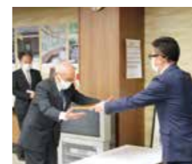
令和3年12月6日に第6回桑名市市政功労表彰式が行われました。

桑名市市政功労表彰とは市の産業経済、教育文化、社会福祉、治安防災、スポーツなど、各分野における功績により市の発展、公益増進に特に功労のあった個人、団体を広く表彰するものです。