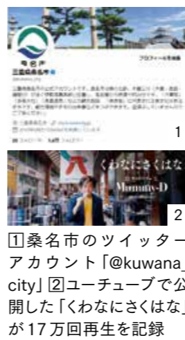
1 桑名市のツイッターアカウント「@kuwana_city」 2 YouTubeで公開した「くわなにさくはな」が17万回再生を記録

※SNSは、ソーシャルネットワークワーキングサービスの略で、登録された利用者同士が交流できるウェブサービスのことです。