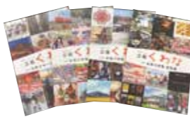
本物力特集総集編

平成28年から、市が誇る魅力を紹介する「本物力特集」を4年間にわたって広報くわなに掲載してきました。現在も、特集だけをまとめた[別冊]本物力特集総集編の販売(1冊500円)を行っています。また、桑名ほんばくの参加者は6年間で約7,000人となり、継続した魅力の発信を行ってきました。