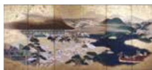
帆山花乃舎《屏風「桜狩」》館蔵