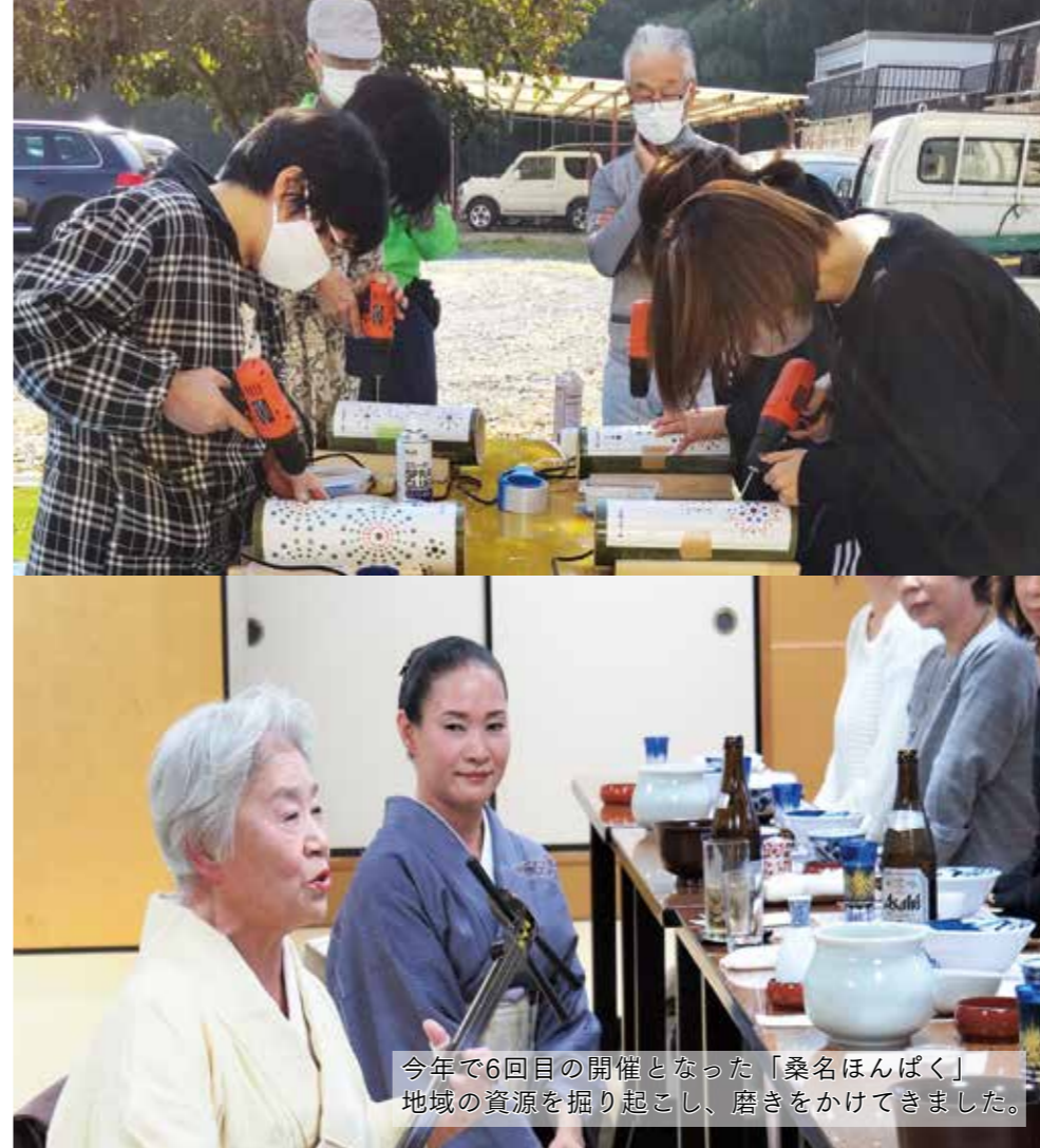
今年で6回目の開催となった「桑名ほんぱく」地域の資源を掘り起こし、磨きをかけてきました。