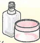
● 化粧びん (飲料用のびん類とは成分が異なりますので、「資源物」には出さないでください)