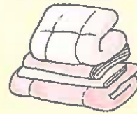
●掛け布団、敷き布団