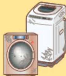
●洗濯機・衣類乾燥機