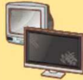
●テレビ (ブラウン管・ 液晶・プラズマ)