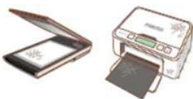
●プリンター ●スキャナー ●ワープロ ●ゲーム機など