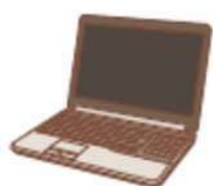
●ノートパソコン本体