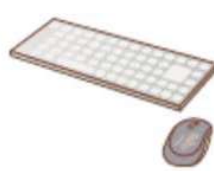
●購入時付属品 ※買ったときについてきた マウス・キーボード・ スピーカーなど (本体と一緒に回収します)