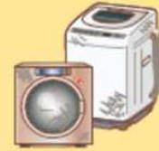
●洗濯機・ 衣類乾燥機