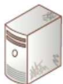
●デスクトップパソコン本体