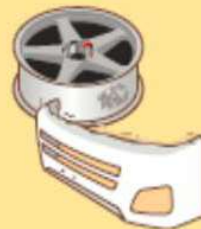
●車の部品 (ホイール・バンパー等)