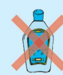
Vidro de cosméticos