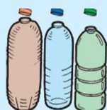
Garrafas PET coloridas

※ Esvazie e passe água no seu interior O que estiver encardido é "lixo queimável"