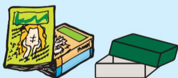
Papeis diversos (revistas, outros papeis usados)

Caixas de papel para bebida As caixas com a parte interna prateada devem ser descartadas como "lixo queimável"