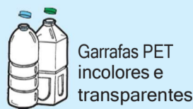
Garrafas PET incolores e transparentes