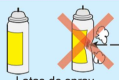
Latas de spray, Cilindro de cassete

※ Utilize todo o conteúdo da lata de spray e Cilindro de cassete e descarte sem furá-la