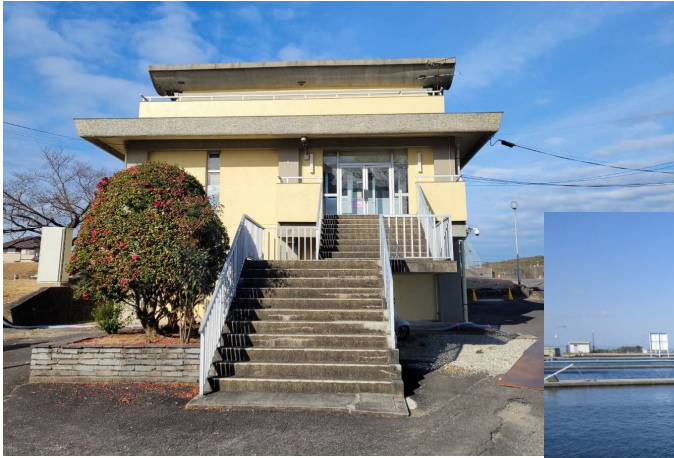
《桑名市上野浄水場》