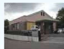
ひめごぜんおすいちゅうけい じょう ⑨姫御前汚水中継ポンプ場