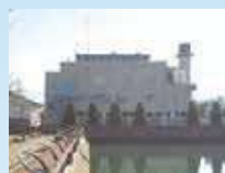
すみよし じょう ③住吉ポンプ場