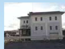
じんない じょう ②甚内ポンプ場