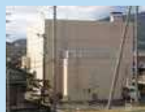
かとり じょう ①香取ポンプ場