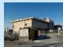
え ば じょう ④江場ポンプ場