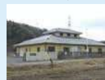
おおやまだいさんちゅうけい じょう ⑦大山田第三中継ポンプ場