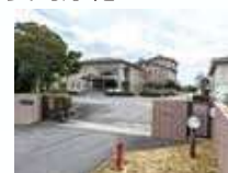
たつた たいへいちくのうきょう ⑪立田・太平地区農業 しゅうちくはいすいしよしせつ 集落排水処理施設