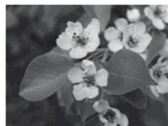
マメナシ (イヌナシ)

このように桑名市は豊かな自然環境を有し、希少な動植物が生息する地域となっています。