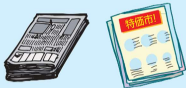
报纸、报纸内的传单