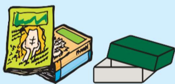
其他纸类(杂志、其他旧纸)

※以下垃圾无法作为其他纸类回收再利用 保鲜膜纸芯、经塑封的纸、蜡纸、带粘着物的纸、照片、 合成纸、防水纸、感热纸、复写纸、无碳复写纸、有味道的纸张、 烫金烫银的纸、和纸(半纸)、碎纸机处理过的纸