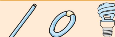
长条形、环形、螺旋形荧光灯