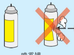
喷雾罐、 卡式炉煤气罐