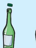
其他颜色的瓶子(绿色、黑色、蓝色)