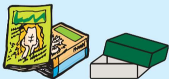
其他纸类(杂志、其他旧纸)

※以下垃圾无法作为其他纸类回收再利用 保鲜膜纸芯、经塑封的纸、蜡纸、带粘着物的纸、照片、 合成纸、防水纸、感热纸、复写纸、无碳复写纸、有味道的纸张、 烫金烫银的纸、和纸(半纸)、碎纸机处理过的纸