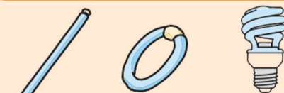
长条形、环形、螺旋形荧光灯