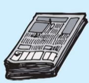
报纸、报纸内的传单