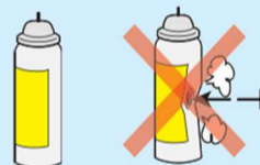
喷雾罐、 卡式炉煤气罐