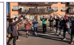
キートンズ城南ノルディックウォーキング

場所：明圓寺境内 開催日：毎週月曜午前9時30分～10時 内容：桑名いきいき体操