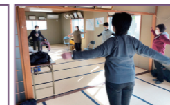
東正和台集会所通いの場

場所：高塚第2公園 開催日：毎週月曜午前9時～9時30分 内容：桑名いきいき体操