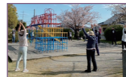
高塚いきいき体操

通いの場とは…介護予防、閉じこもり予防、健康づくりのため、集会所などの場所で、地域住民が運営する「地域住民の集う場」 フレイルとは…高齢者の健康状態と要介護状態の間にある「虚弱状態」のこと