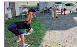
いきいき体操須賀の馬場

場所：藤が丘デザイン公園 開催日：毎週水曜午前9時30分～10時 内容：桑名いきいき体操