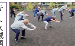
デザイン公園いきいき体操の会

場所：城南まちづくり拠点施設 開催日：第3月曜午前9時～10時 内容：ノルディックウォーキング