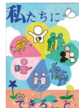
2021年度 桑名市「人権に関するポスター」入選作品