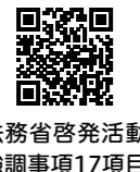
法務省啓発活動強調事項17項目