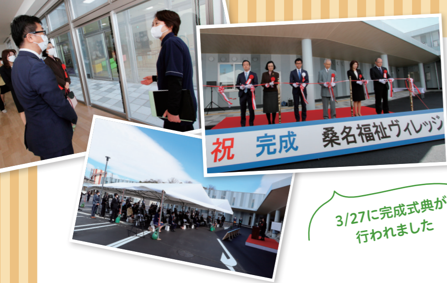
祝 完成 桑名福祉ヴィレッジ