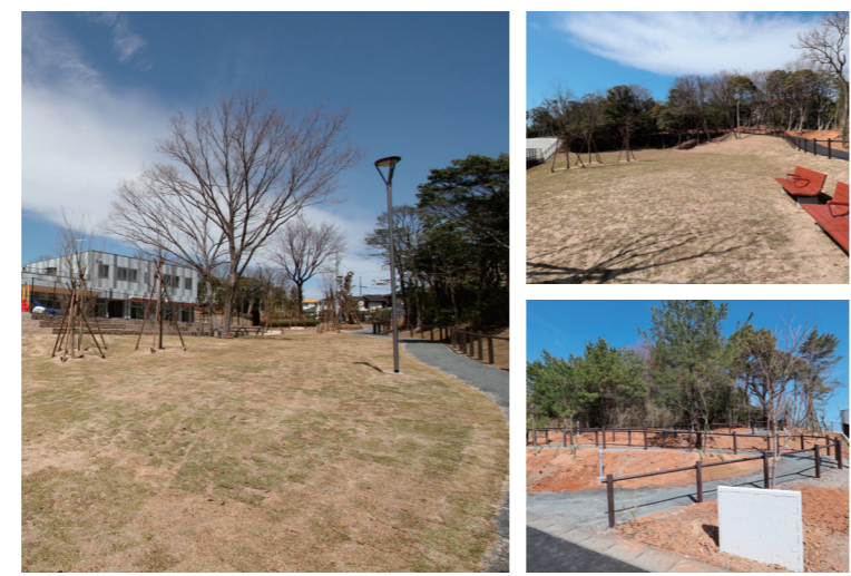
● 芝生広場 既存林を生かしつつ適度な植栽を行い、身近に自然を感じられる公園です。芝生を養成中のため、丁寧にお使いください。

既存林を生かした緑あふれる広場 ヴィレッジ公園(やまざきパーク) 芝生広場と散策路からなる公園。ヴィレッジ公園の愛称「やまざきパーク」は、福祉ヴィレッジに移転される前の福祉施設の土地が、戦後まもなく山崎氏から寄付を受けたことに由来しています。そのご意思に敬意を表し、またこれまで行ってきた福祉サービスを、この福祉ヴィレッジで引き継ぐという意味を含め名付けました。