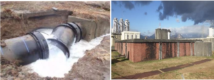
東日本大震災による水道管の被災状況