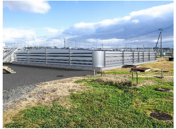
耐震化された西部水源地浄水池の完成イメージ (R5年度完成予定)