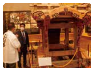
展示されている四輪地車

今年の石取祭はコロナの影響で休祭する地区もあり、例年通りのにぎわいのある雰囲気とは異なるかもしれませんが、ユネスコ無形文化遺産に登録されている伝統文化、地域の宝を守り抜くんだという皆さんの強い意志を聞いていただきたいと思います。