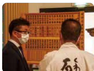
今年の石取祭車渡祭順番表