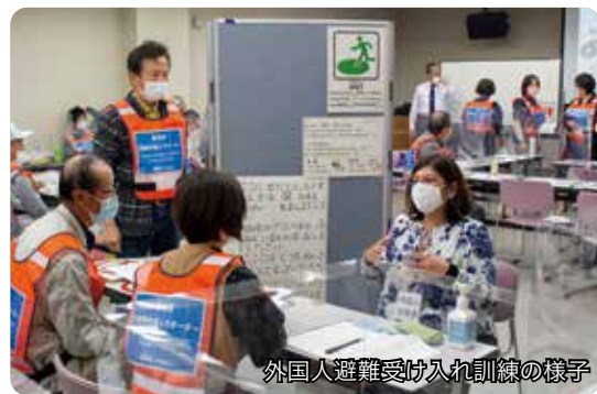
外国人避難受け入れ訓練の様子