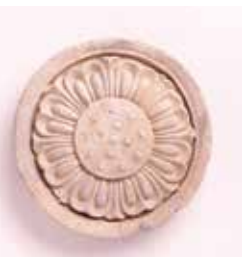
《額田廃寺発掘 川原寺様式 複弁蓮華文軒丸瓦》館蔵

古代最大の皇位継承戦争「壬申の乱」から1350年。壬申の乱において桑名が果たした役割などを紹介します。また、特集陳列「刀剣セレクションII」を同時開催します。