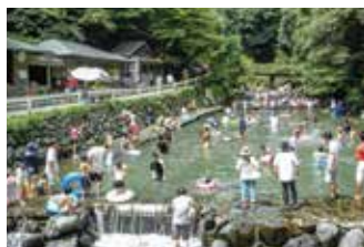
多度峡天然プール

夏は水遊びが楽しい季節です。特に小さなお子さんはビニールプールで遊ぶことが多いと思います。でも洗面器やバケツなどでパシャパシャ水に触れたり、カップで水をすくったりするだけでも、十分気持ち良く遊んでくれますよ。