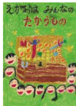
2021年度 桑名市「人権に関するポスター」入選作品