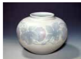
【茨城県指定有形文化財】板谷波山《葆光彩磁葡萄紋様花瓶》茨城県陶芸美術館蔵