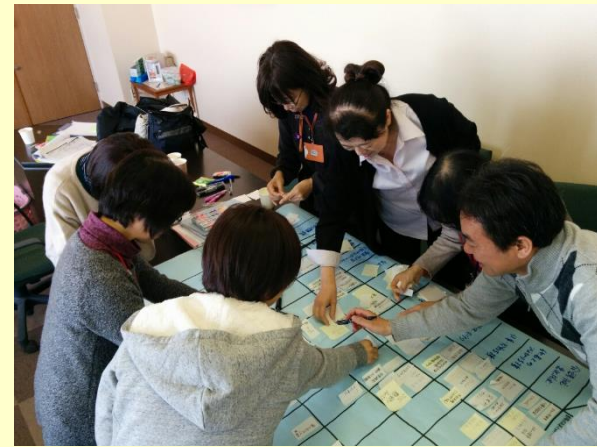
ワーキングチームによるケアパス作成の様子