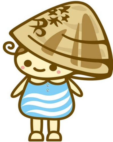
桑名市 イメージキャラクター 「ゆめはまちゃん」

「桑名市地域包括ケア計画」は、 「オール桑名」での「地域包括ケアシステム」の構築に向けた 取り組みの集大成です。