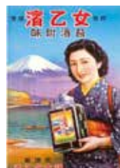
神内生一郎《演乙女味附海苔(専用商標)ポスター》 桑名市博物館蔵

かみうちせいいちろう 神内生一郎によるポスター原画などから、人々の日常生活に寄り添ってきたデザインの粋をご覧ください。