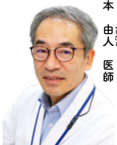
総合医療センター 非常勤医師