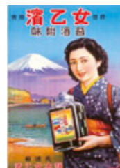
神内生一郎《濱乙女味附海苔(専用商標)ポスター》 桑名市博物館蔵