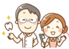
公益財団法人 8020推進財団 平成30年11月永久歯の抜歯原因調査