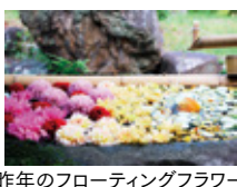
昨年フローティングフラワー

【開苑】 午 前 9時～午 後 5時(入苑は午 後 4時まで) 【入苑料】 460円