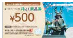
得とく商品券イメージ