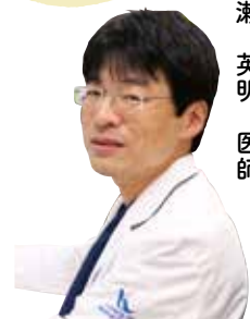
総合医療センター 泌尿器科部長

「若い時は夜トイレに起きる事がなかったのに」と悩まれている人は多いと思います。実は、男女ともに50歳を過ぎれば60%以上、70歳以上では90%以上の人が夜1回以上、さらに80歳以上では2人に1人が3回以上トイレに起きています。このように夜間にトイレに起きる「夜間頻尿」は年齢が大きく影響しています